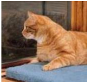
Mantenga a su Gato Seguro en Casa.

Los dueños de gatos son responsables por el comportamiento y bienestar de sus mascotas. Albuquerque y comunidades en sus alrededores cuentan con ordenanzas que exigen licenciar, vacunar, y esterilizar o castrar a su gato. Tales ordenanzas además requieren que su gato se encuentre confinado a su vivienda o propiedad, ya sea dentro de casa o dentro de un área cercada a prueba de escape.